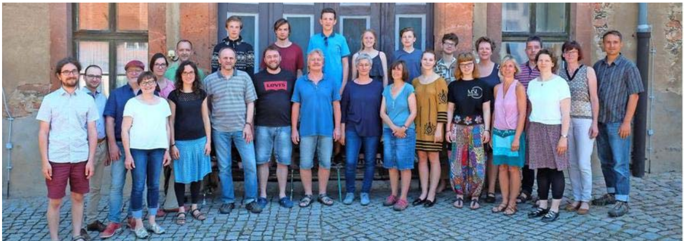
Die Mitglieder des Kammerchores beim Probenlager im Kloster Wechselburg bei Rochlitz.

| Artikel veröffentlicht: 01. Juni 2017 05:35 Uhr